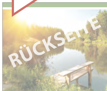
Bild Ihrer Umgebung mind. 100x75mm | 300 dpi