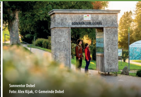
Sonnentor Dobel