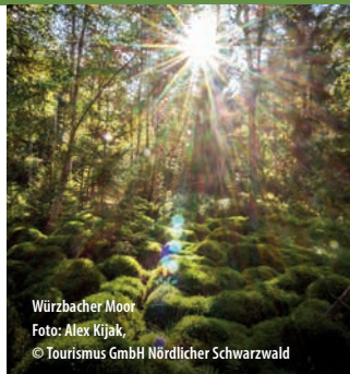
Würzbacher Moor