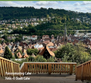
Panoramasteg Calw

Einsteigen, zurücklehnen und den Schwarzwald entdecken